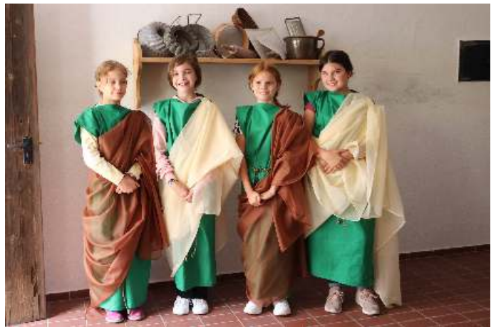
Die Museumsfreunde luden zum Römertag ein, bei dem u.a. leckeres römisches Essen im Römerlager gekocht und Spiele wie die römische Mühle gebastelt wurden. Unser Foto zeigt einen Teil der Teilnehmer - natürlich in passender Verkleidung!