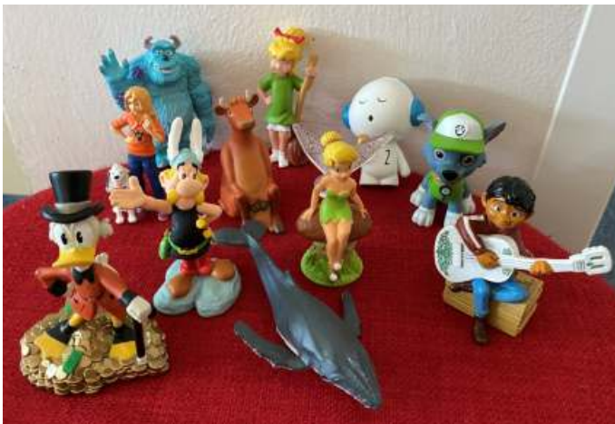
Neue und spannende Tonies warten auf euch!

Wenn sich Asterix und Tinkerbell die Hand geben, Bibi Blocksberg und Mama Muh lustige Geschichten erleben und sich dann noch die Monster AG den Platz mit Dagobert Duck teilt – ja dann stehen in der Bücherei viele neue Tonies für euch bereit!