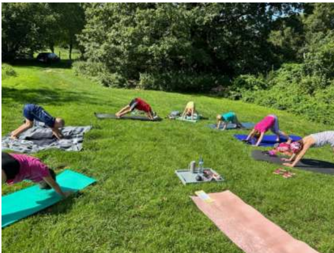
Yoga für Kinder: Yoga wirkt positiv auf unseren Körper und fördert unter anderem die Beweglichkeit, es kräftigt die Muskulatur und steigert das allgemeine Wohlfühlgefühl. Die Kinder wurden spielerisch an die verschiedenen Yogaübungen herangeführt.