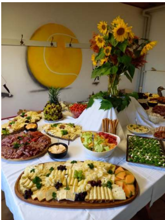
Das Buffet beim diesjährigen Käsefest war eine Augenweide.

Auch im September hat der TCM einiges vor: die Clubmeisterschaften der Jugend sowie im Doppel- und Mixedwettbewerb, das Gaudi-Schleifchenturnier und die Teilnahme an diversen Landkreisturnieren.