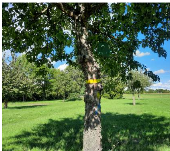
Viele Mertinger Obstbäume sind mit dem „Gelben Band“ (landkreisweite Aktion des Landratsamtes) gekennzeichnet: Hier ist das Pflücken von Obst ausdrücklich erlaubt.

Veranstaltungsort: Aula der Antonius-von-Steichele-Grundschule