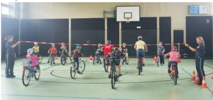
Am 02.08. bot die Verkehrspolizei Donauwörth ein tolles Ferienerlebnis. Hier drehte sich alles um das Thema Fahrrad & Verkehrssicherheit. Die Kombination aus lehrreichen Aktivitäten und unterhaltsamen Spielen sorgte für strahlende Gesichter bei den Teilnehmern.