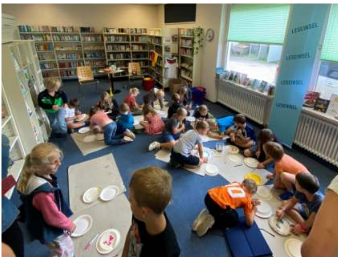
Die Kinder bastelten fleißig an den Krachmachern.