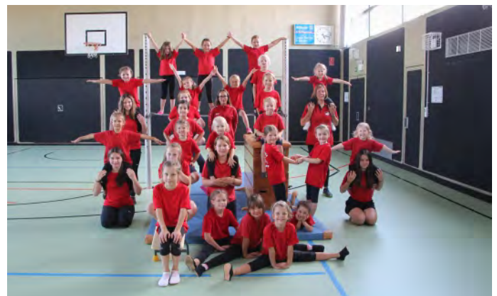
Auch für die Kleinsten ist das Mertinger Mädchenturnen das Größte!

Die Turngeräte werden gemeinsam aufgebaut. Im Anschluss folgt das Warm-Up, das auch als gemeinsames Anfangsspiel gestaltet wird. Danach wird an den Geräten geturnt (Boden, Schwebebalken, Sprung und Reck), aber auch an anderen Geräten wie Ringe, Trapez, Barren, Trampolin oder an Stationen mit Bällen, Seilen oder Reifen. Den Abschluss einer Turnstunde bilden der Abbau der Geräte und das gemeinsame Abschlussspiel. Auf die besonderen Turnstunden in der Faschingszeit sowie auf die Weihnachtsfeier mit Vorturnen und Tanzdarbietungen für die Familien freuen sich die Mädchen sehr.