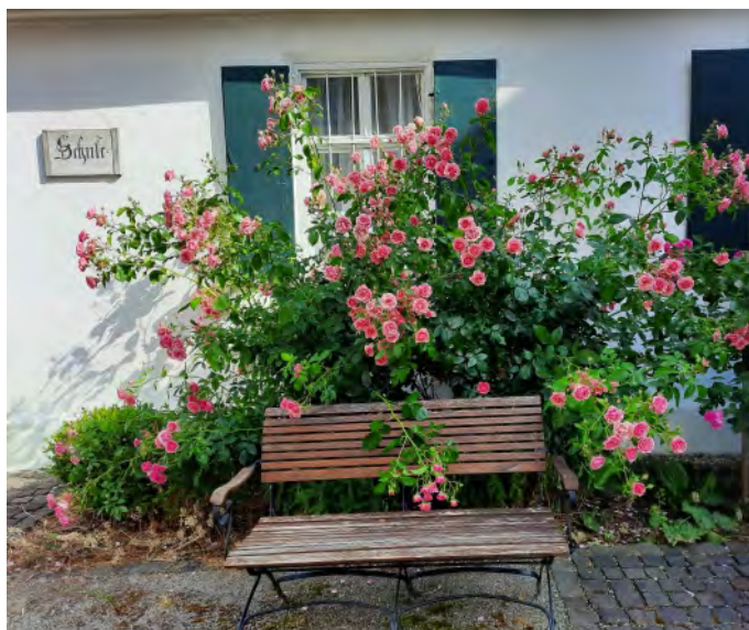
Die Museumsfreunde Mertingen eröffnen im September das neue Ausstellungsjahr. Erfahren Sie dazu mehr in unserer nächsten Ausgabe.