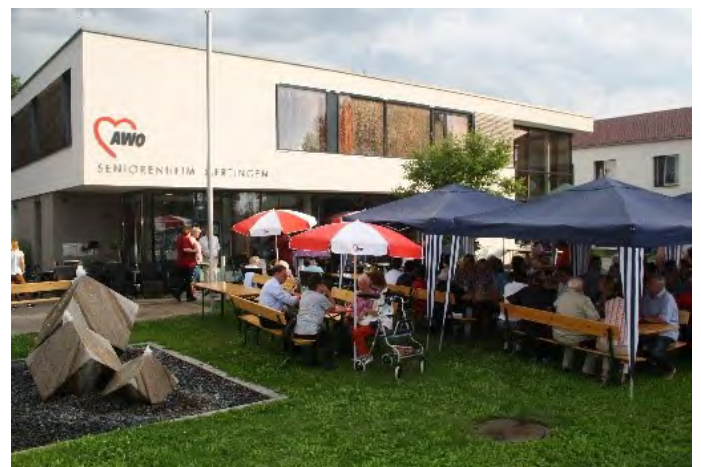
Der AWO Ortsverein lädt herzlich zum Dämmerstopp beim AWO Seniorenheim ein. Es erwartet Sie ein gemütlicher Abend bei schöner Musik und kulinarischen Köstlichkeiten!