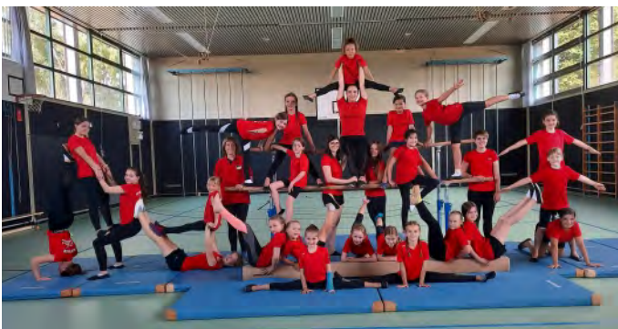
Turnen macht den Kindern nicht nur Spaß, sondern ermöglicht ihnen vielfältige Bewegungserfahrungen. Hier präsentiert sich die große Gruppe im Kreis ihrer Trainerinnen.

Das Mertinger Mädchenturnen ist seit vielen Jahren eine feste Größe im Vereinsangebot des FC Mertingen. Hier wird Turnen als äußerst beliebter Breitensport schon bei den Kleinsten ganz großgeschrieben. Neben dem Spaß und der Freude an der Bewegung bietet dieser Sport auch eine vielfältige und grundlegende Bewegungserfahrung sowie ganzheitliche, pädagogisch wertvolle Bewegungsförderung für eine gesunde Entwicklung. Hier erfahren die Mädchen nicht nur ein starkes Gemeinschaftsgefühl, sondern werden kindgerecht, spielerisch und individuell gefördert. Trainiert wird das ganze Jahr über (außer in den Schulferien). Die Voraussetzungen, das Mädchenturnen in dieser Form anbieten zu können, schaffen Trainerinnen, die mit viel Herzblut und Engagement ehrenamtlich die Kinder trainieren, motivieren, begleiten und fördern. Aufgrund der großen Beliebtheit des Mädchenturnens sucht die Turnleitung aktuell Verstärkung im Trainerteam.