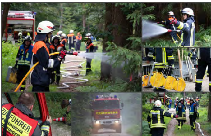
Für den Ernstfall gut gerüstet: Über 100 Einsatzkräfte beteiligten sich im Mertinger Forst an einer Waldbrandübung – das Thema Wald- und Vegetationsbrände wird auch hier in Mertingen immer wichtiger.