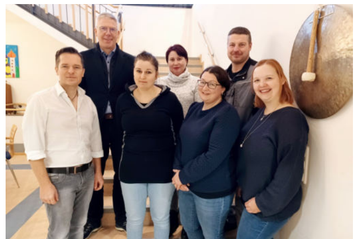
Die neuen Mitarbeiterinnen freuen sich auf ihren neuen Wirkungskreis.