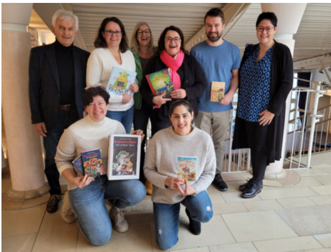
Viel Freude bereiteten die Vorleserinnen und Vorleser den Schulkindern.