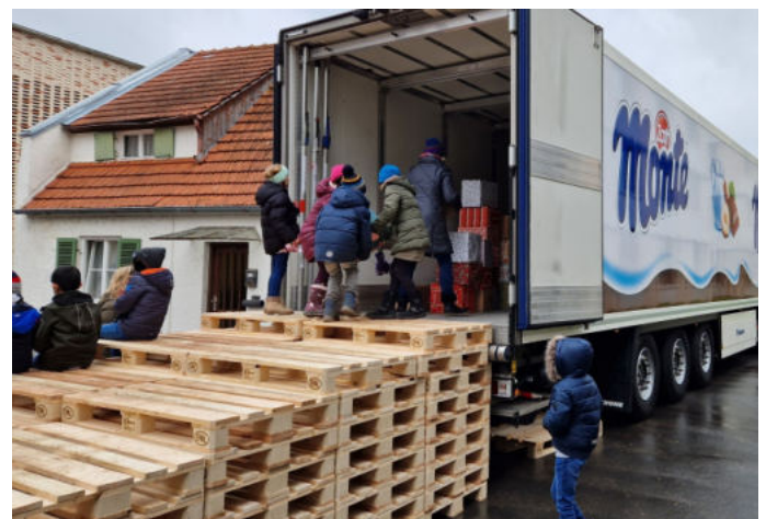
Fleißig schleppten die Schüler die Pakete in den großen LKW.

Auch an der Mertinger Grundschule kam wieder ein großer Berg an Spendenpäckchen zusammen – fast 40 Stück brachten die Hausmeister mit ihrem großen Anhänger zum Gelände der Zott-Verwaltung. Dort fand wie in den vergangenen Jahren die Übergabe und Beladung des großen LKW statt.