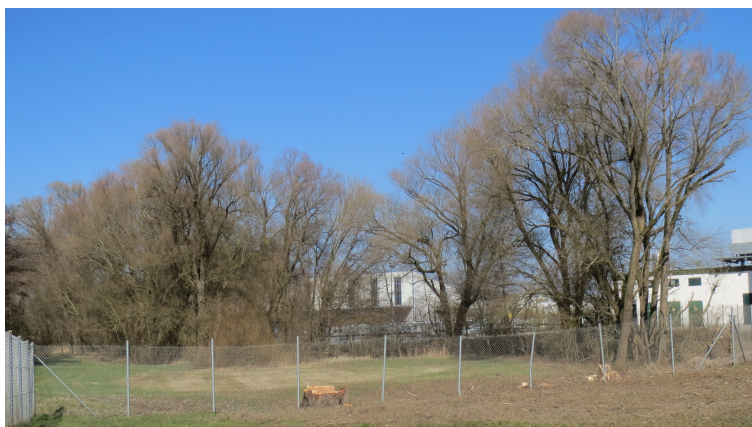
Abb. 3: Übersicht gerodeter Bereich

Die Bohrung der Baumhöhlen erfolgte im Zuge der Rodungsarbeiten am 17.02.2021 (s. Abb. 4).