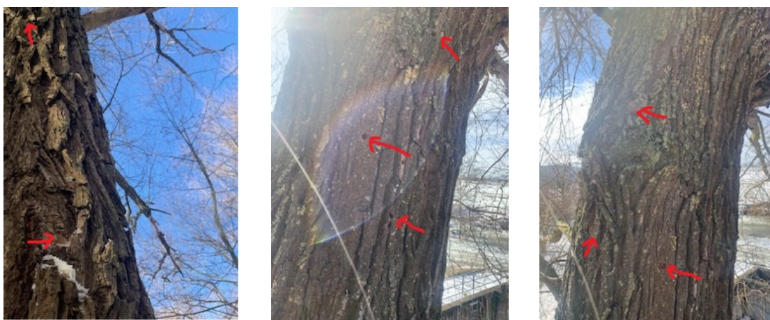
Abb. 4: Übersicht Baumhöhlen

Die Bohrung der Baumhöhlen erfolgte im Zuge der Rodungsarbeiten am 17.02.2021 (s. Abb. 4).