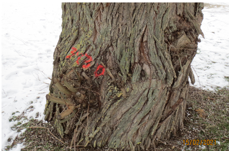
Abb. 2: Markierung Maßnahmenbäume