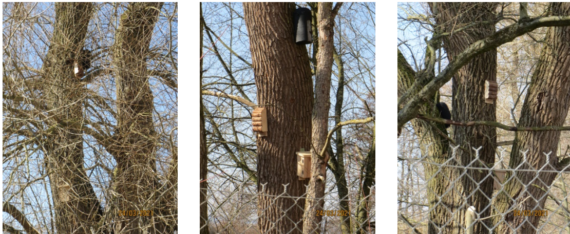
Abb. 5: Übersicht Fledermauskästen

Das Aufhängen der Fledermauskästen erfolgte am 17.03.2021 (s. Abb. 5). Damit waren alle Maßnahmen umgesetzt.