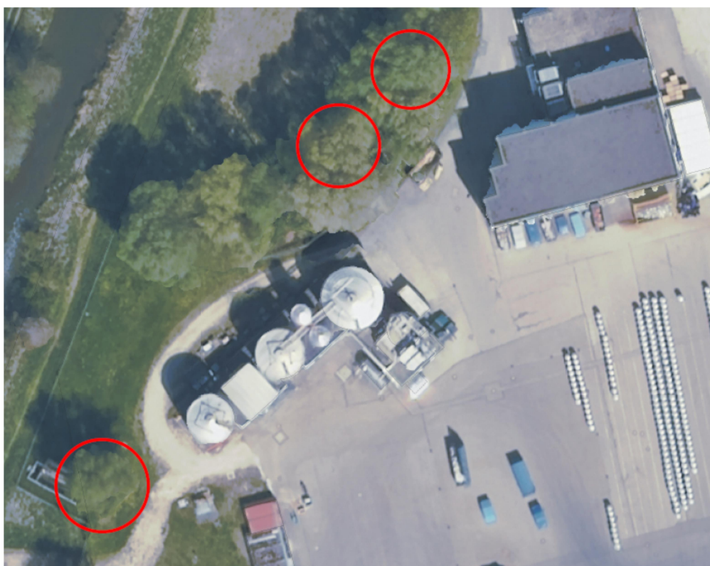
Abb. 1: Übersicht Bäume für Maßnahmen (Quelle Luftbild: FIN Web)

Es wurden 3 Bäume für die Anlage von Baumhöhlen und das Aufhängen von Fledermauskästen ausgewählt und markiert (s. Abb. 1 und 2).